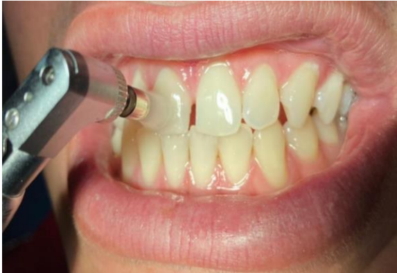
11 – Profilaxia.