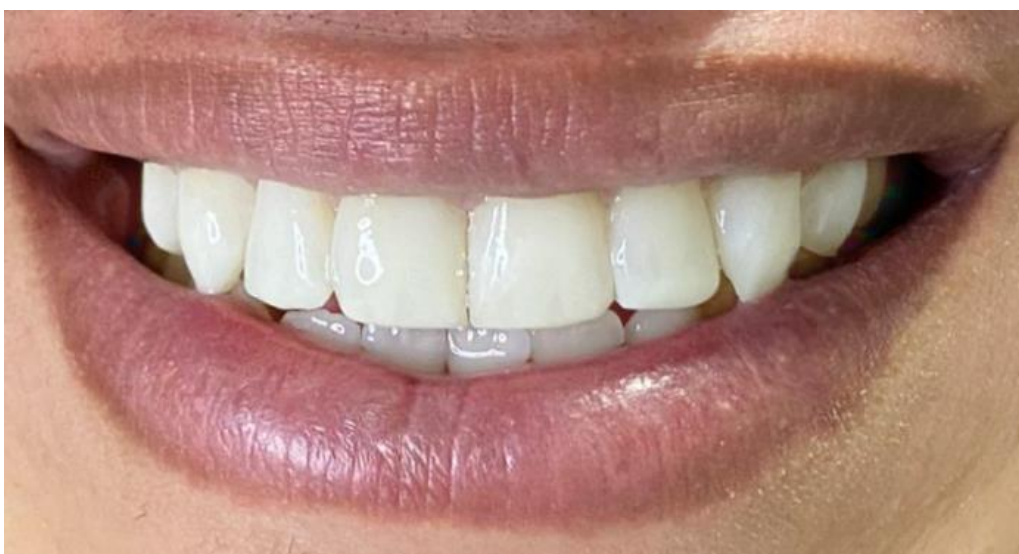
Imagem do Resultado Final

O resultado final foi muito satisfatório, tudo aconteceu como planejado, devolvendo estética, função também, pois percebemos que melhorou muito a fonação e acima de tudo a qualidade de vida, o paciente relatou que ficou extremamente feliz e sorrindo atoa, o sorriso e o rosto ficaram harmônico e muito bonito, mudou completamente para melhor.