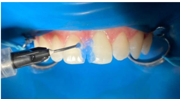
12 – Ácido fosfórico 37%