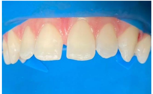
12 – Isolamento Absoluto.