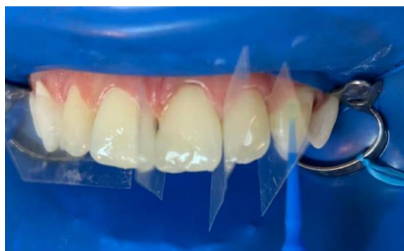
17 – Camada de Adesivo na vestibular e palatina.