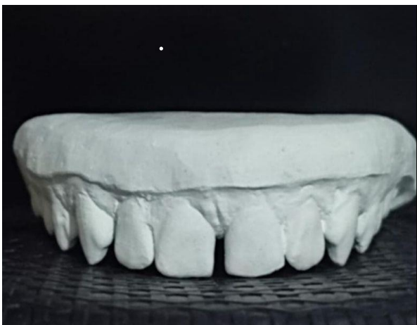
1 – Modelo em gesso.