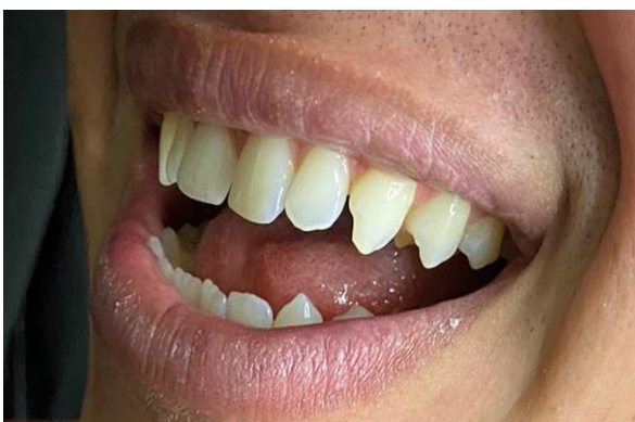
6 – Vista lateral.