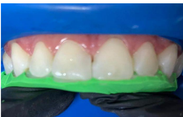
18 - Camada palatina com Guia.