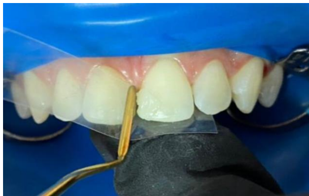
15 - Incremento de resina composta