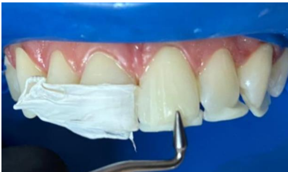
20 – Camada de resina de Corpo.