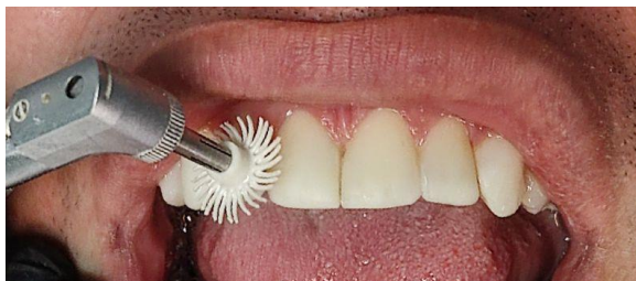
25 – Polimento com Disco Espiral.