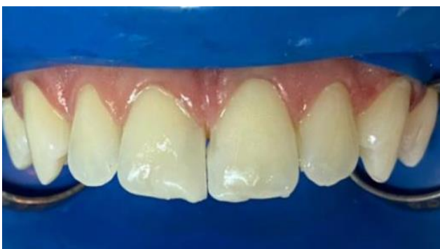
16 – Diastema fechado.