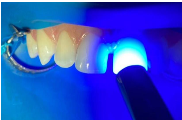
14 – Fotopolimerizador 20 segs.